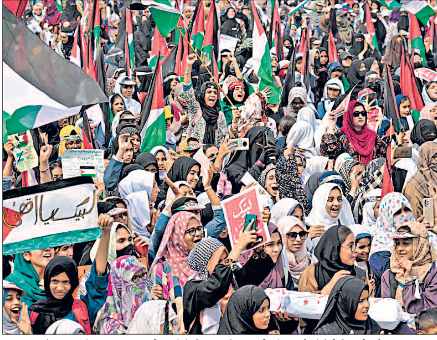
इस्लामाबाद में बुधवार को गाजा पर इजरायली हमलों के खिलाफ और फलस्तीन के समर्थन में रैली निकाली गई।