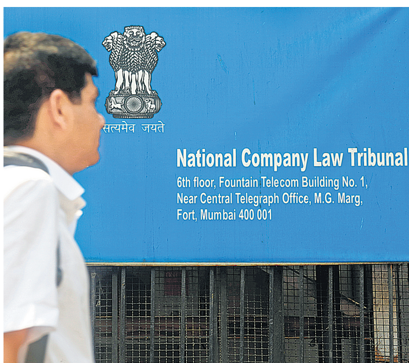
The liquidator had filed a plea before the NCLT in January 2022 seeking the refund from the tax department on behalf of the beleaguered travel company Cox and Kings.

The 1 November order of the tribunal said that Cox & Kings was admitted for insolvency proceedings on 21 October 2019, following which a moratorium was imposed.